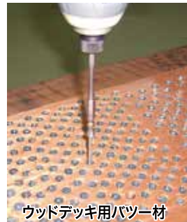
ウッドデッキ用バツ材